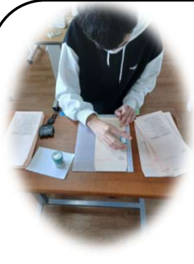
1.封筒にはんこを押す

ジョブサポートあおねっとです。今回はジョブトレーニングのなかの広報発送作業の様子をご紹介します！